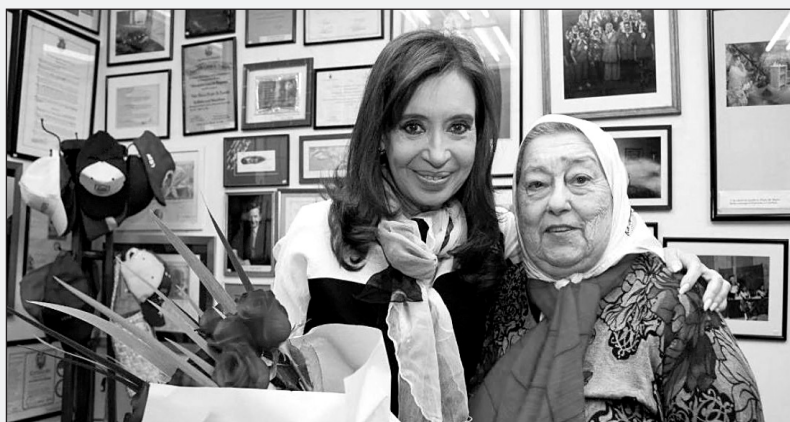
Los organismos de derechos humanos deben ser independientes de los gobierno de turno

En un contexto donde la justicia investiga diversos hechos de corrupción del gobierno kirchnerista y donde la misma Bonafini está imputada por desvío de fondos para la construcción de viviendas a través de “Sueños Compartidos”, la reunión con Cristina no obedece a ninguna reivindicación de los derechos humanos.