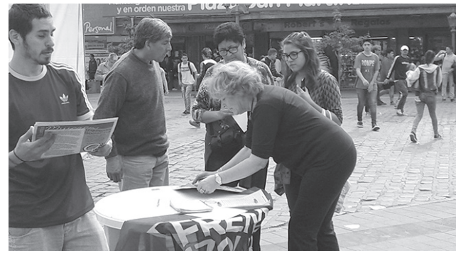
Venta de nuestro periódico en Córdoba (arriba) y Neuquén

Le pedimos, amigo lector, que nos ayude suscribiéndose a El Socialista . Recibiendo de aquí hasta fin de año nuestro periódico por la suma de 200 pesos. Sabemos que es un esfuerzo económico en momentos en que a los trabajadores no nos sobra nada, pero al suscribirse nos está dando una mano para poder avanzar. ¡Suscribite!