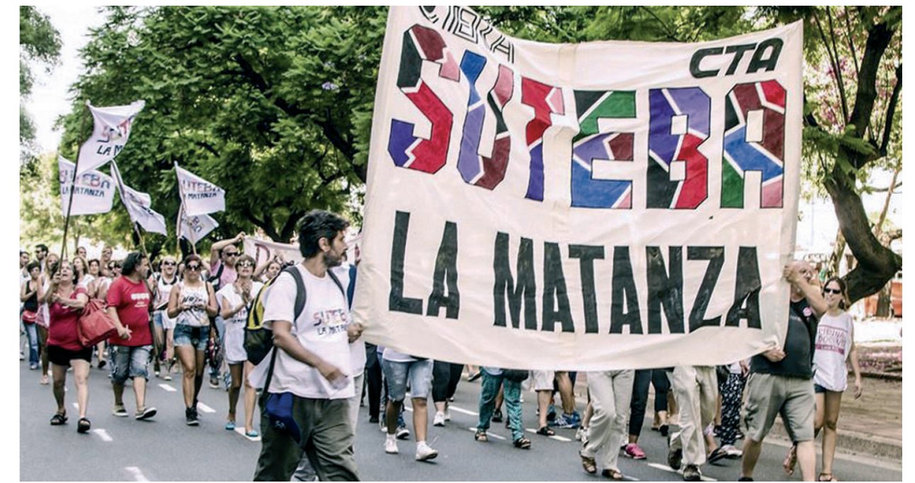
Marchas del Suteba La Matanza y docentes de Santa Cruz

"Además exigimos mayores contrataciones de personal, que las autoridades paguen la deuda previsional y realicen las obras prometidas", finalizó la dirigente. Un ejemplo a seguir para enfrentar la política del gobierno macrista de imponer paritarias por debajo de la inflación.