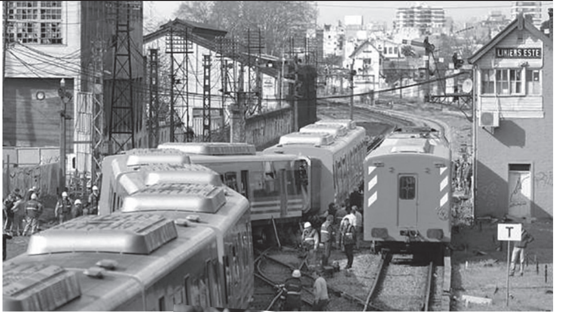
Vista del accidente en Liniers

La cadena de siniestros es larga. La masacre de Once ocurrió hace cuatro años y medio, cuando por una falla de frenos un tren cargado