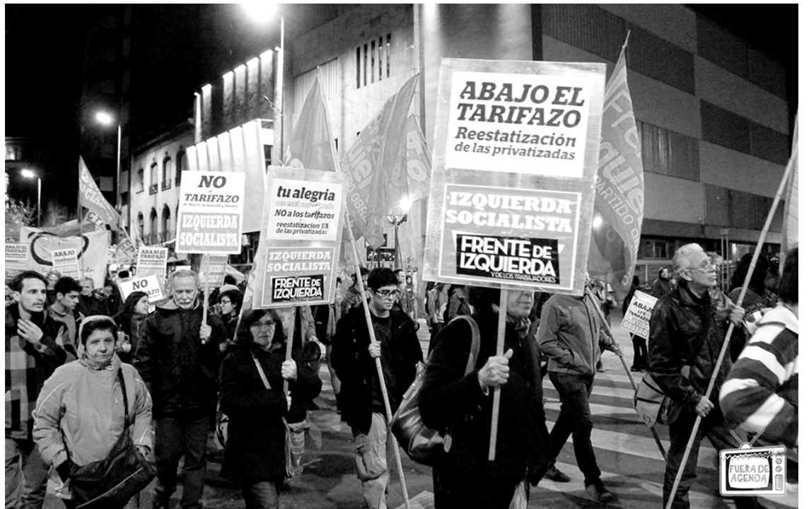
Marcha en Córdoba contra el tarifazo

Mientras las empresas siguen recibiendo subsidios y todo tipo de prebendas, amenazan con cortar los servicios y no pagar los salarios si no se efectiviza el tarifazo. Es un chantaje intolerable: hay que reestatizarlas.