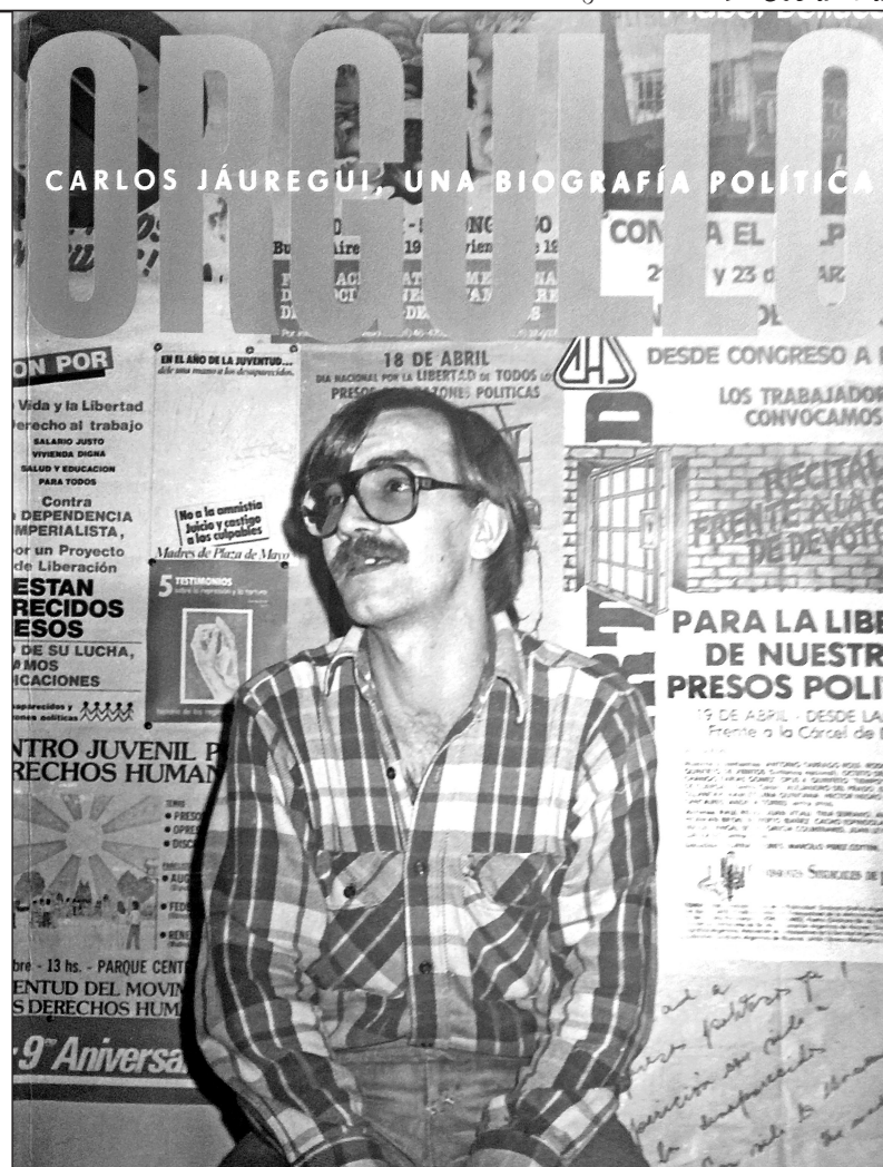
Tapa del libro de Mabel Bellucci sobre la biografía de Jáuregui

Carlos Jáuregui, cuando abandonó la CHA, fue también el primero en percibir los dos peligros que acechaban al movimiento. El primero, quedarse con las igualdades formales. Hoy Argentina tiene la legislación más avanzada del continente sobre la temática; pero la discriminación no ha desaparecido, y se da con un estricto corte de clase. Mientras crecen el negocio de los boliches y el "turismo gay", las chicas travestis siguen en las calles sobreviviendo en estado de prostitución, jóvenes gays