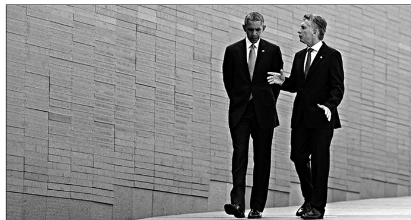
Macri y Obama en el Parque de la Memoria donde constan nombres de parte de los desaparecidos

Macri nos dice ahora que no hay que hablar más de los derechos humanos del pasado -es decir de los desaparecidos, de la lucha por cárcel a los genocidas y por desmantelar el aparato represivo-, sino que hay que