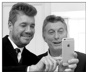
Tinelli con Macri

Desde la muerte del eterno capo mafia Julio Grondona (presidente de AFA durante 35 años) el negocio del fútbol es disputado por empresarios, políticos y dirigentes sindicales. Don Julio conocía bien el paño, pasaban los gobiernos -dictadura incluida- y